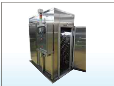
シングルユニット