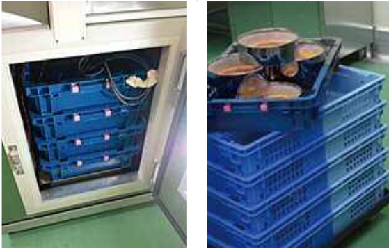
A、Bの冷却状況 (フィードバック急速冷却機)